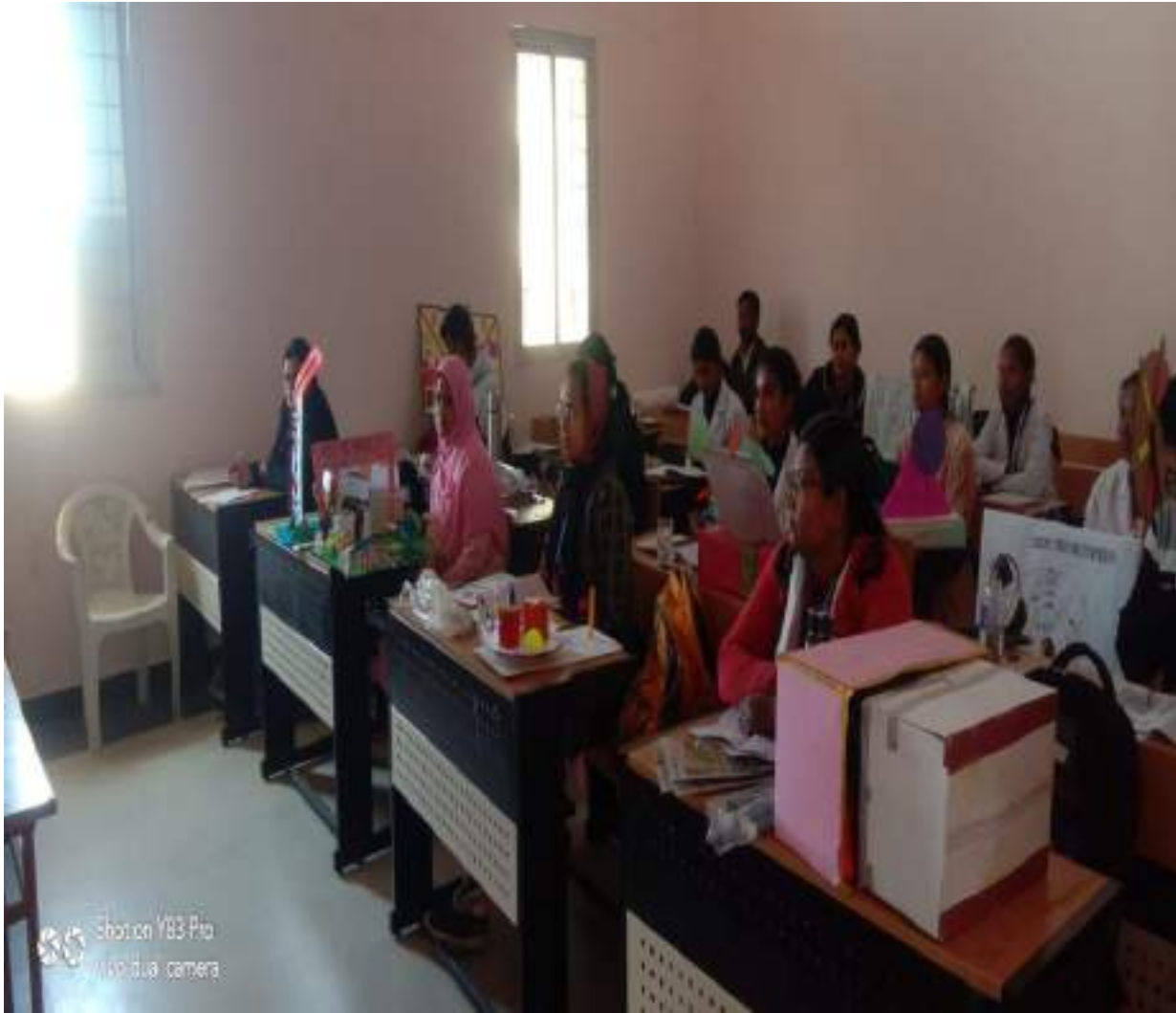
Effectiveness in class room teaching