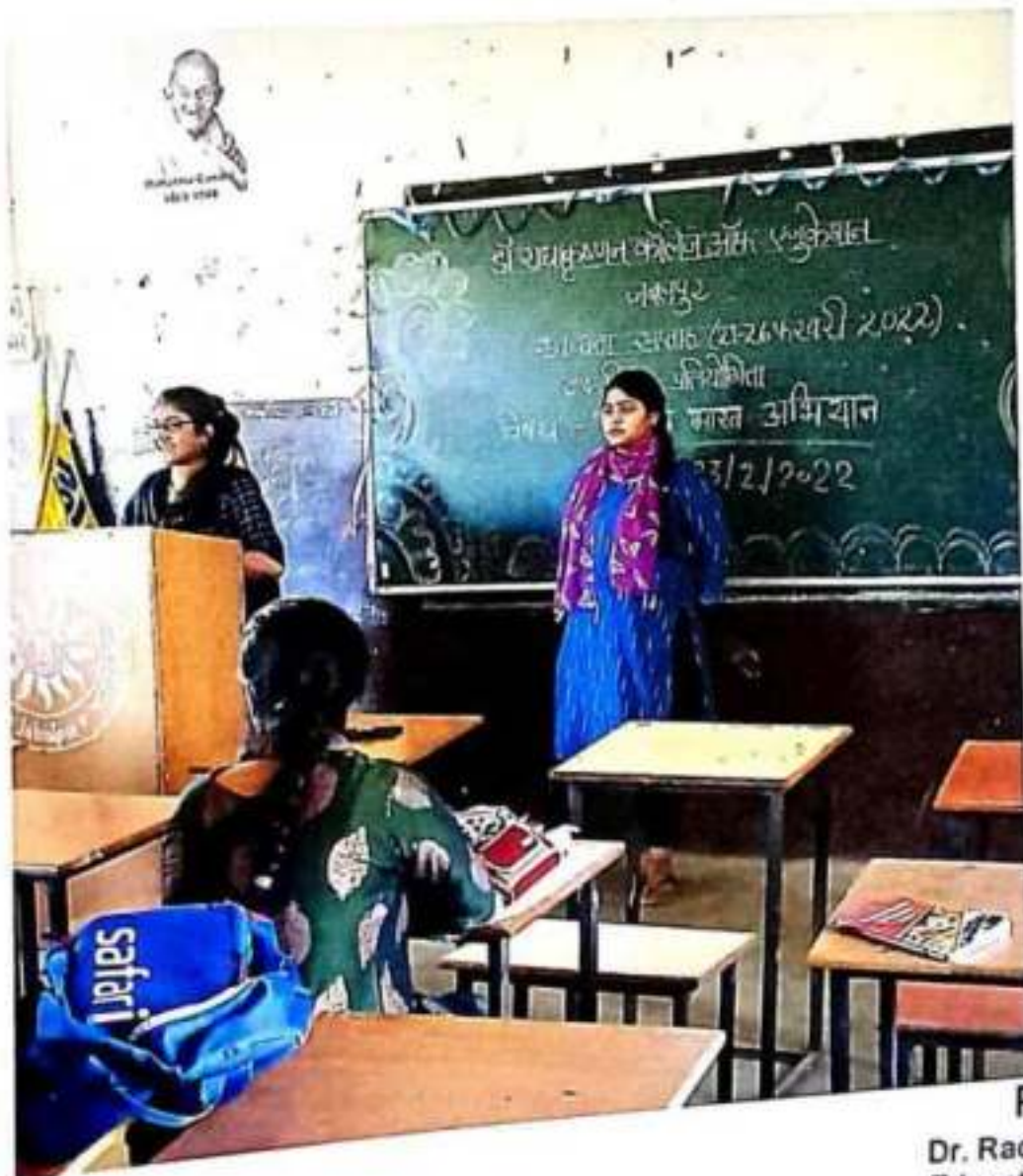
PRINCIPAL Dr. Radhakrishnan College Education Karmeta, Jabalpur