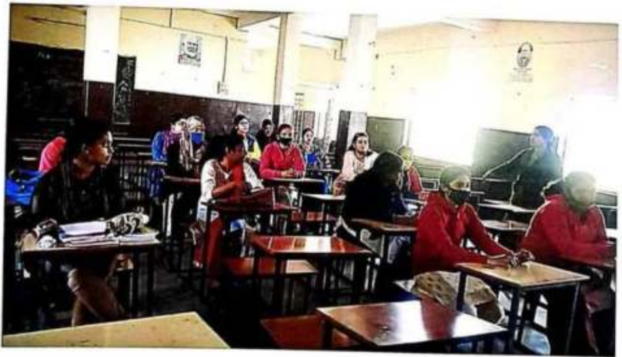
वाद विवाद प्रतियोगिता

Winnan College of Education, Parmeta, Jabalpur