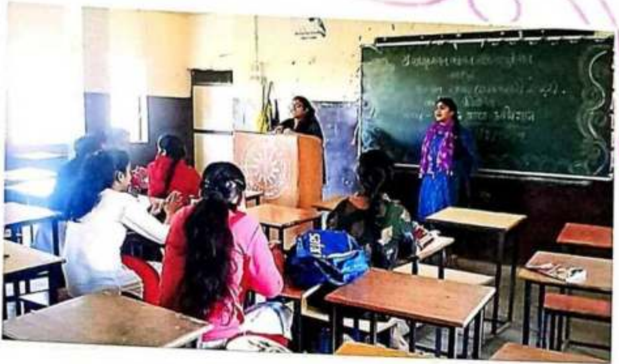
क्वद्व भारत अभियान