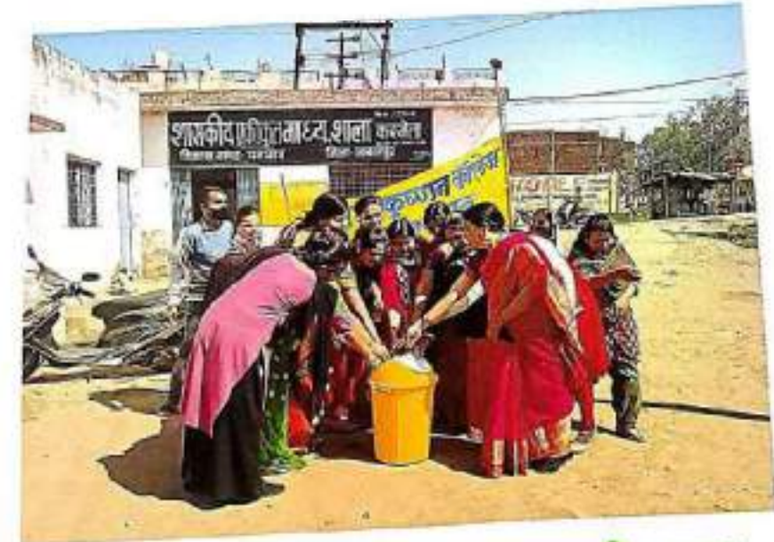
बन्बरहरा जागरकता अभियान